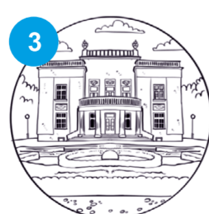
3 Willa Kwiatkowskiego w Tarnowie-Mościcach