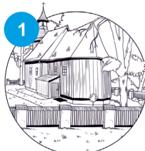
1 Kościół drewniany pw. Trójcy Przenajświętszej „Na Terlikówce” w Tarnowie