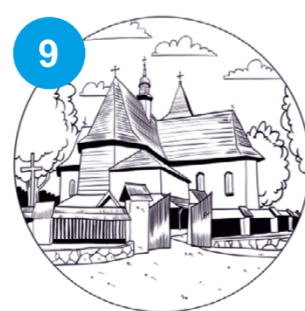
9 Kościół pw. Św. Stanisława Biskupa w Skrzyszowie