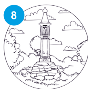
8 Słup graniczny z 1450 r. w gminie Radłów