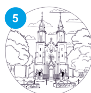
5 Kościół św. Bartłomieja Ap. w Porębie Spytkowskiej