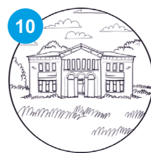
10 Pałac Dąbskich i park w Wojniczu