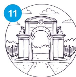
11 Brama wjazdowa do nieistniejącego Pałacu Lubomirskich