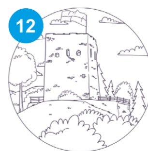
12 Ruiny zamku w Melsztynie