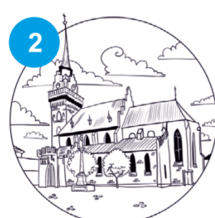
2 Bazylika Katedralna w Tarnowie