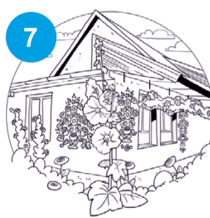
7 Zalpie - „Malowana Wieś”