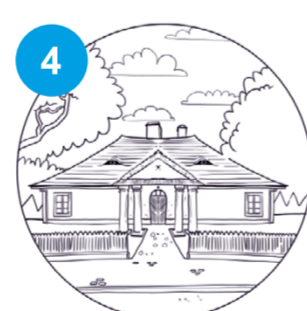
4 Dworek podmiejski w Tarnowie